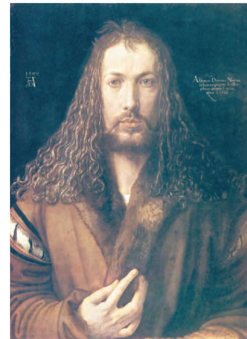
『自画像』 油彩 1500年